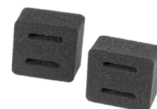
Entretoises utilisables en option