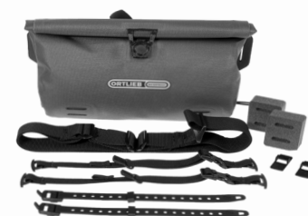
Contenu de la livraison