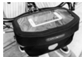
Rangement du smartphone dans le compartiment transparent du couvercle (pas inclus)