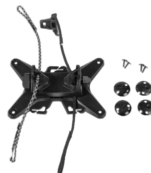
Montage optionnel possible avec le kit de montage Bar-Lock (non fourni)