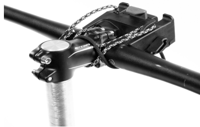
Vue en condition d'installation

Bloc d'adaptateur avec Bar-Lock Film réfléchissant