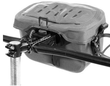
Exemple d'utilisation avec Ultimate