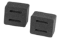
Optional einsetzbare Distanzstücke