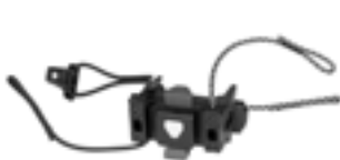
E241 Handlebar Mounting-Set QR