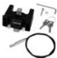
E185 Handlebar Mounting-Set with Lock