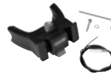
E226 Handlebar Mounting-Set E-Bike