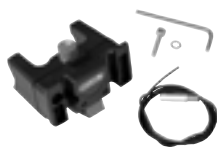
E225 Handlebar Mounting-Set