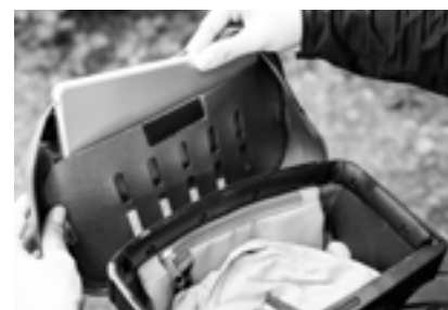
Öffnung Deckelfach: 20,5 cm