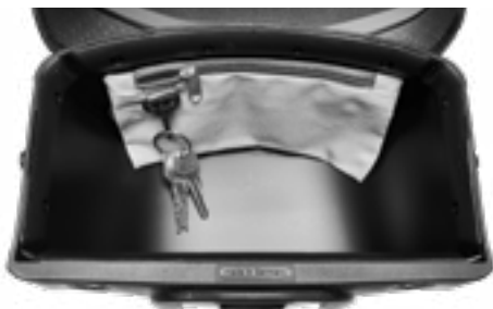
Karabiner mit Schlüsselbund