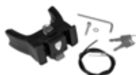
E207 Handlebar Mounting-Set E-Bike with Lock