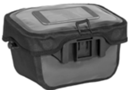
Smartphone im transparenten Deckelfach (nicht enthalten)