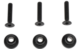
QL3.1 Rastknöpfe (inkl.)